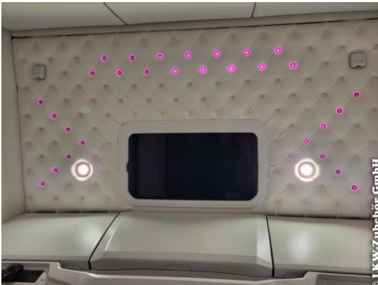
Beispiel LED-Spots im Himmel